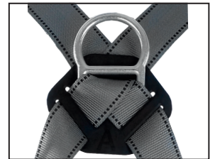
Auffangöse (D-Ring), geschmiedeter Stahl